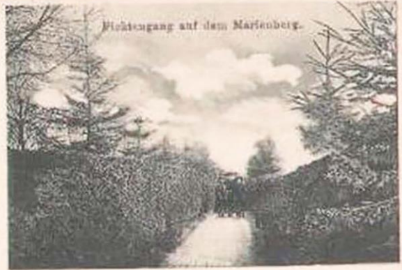
Höchstzugang auf dem Marienberg.