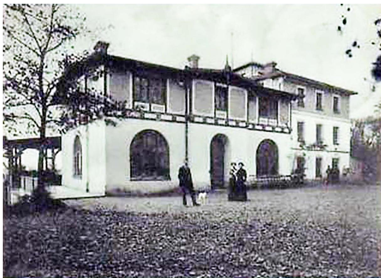
Marionberg - Restaurant