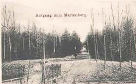
Aufgang zum Marienberg.