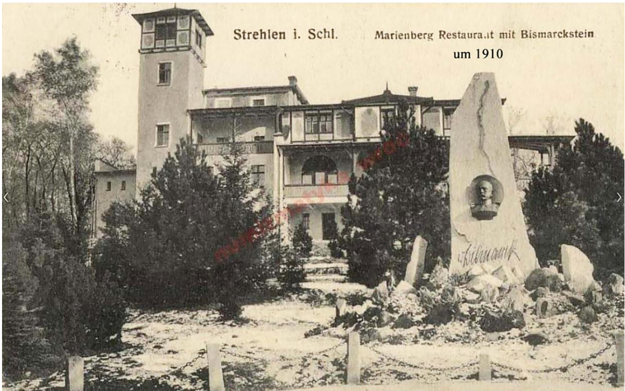
Strehlen i. Schl.