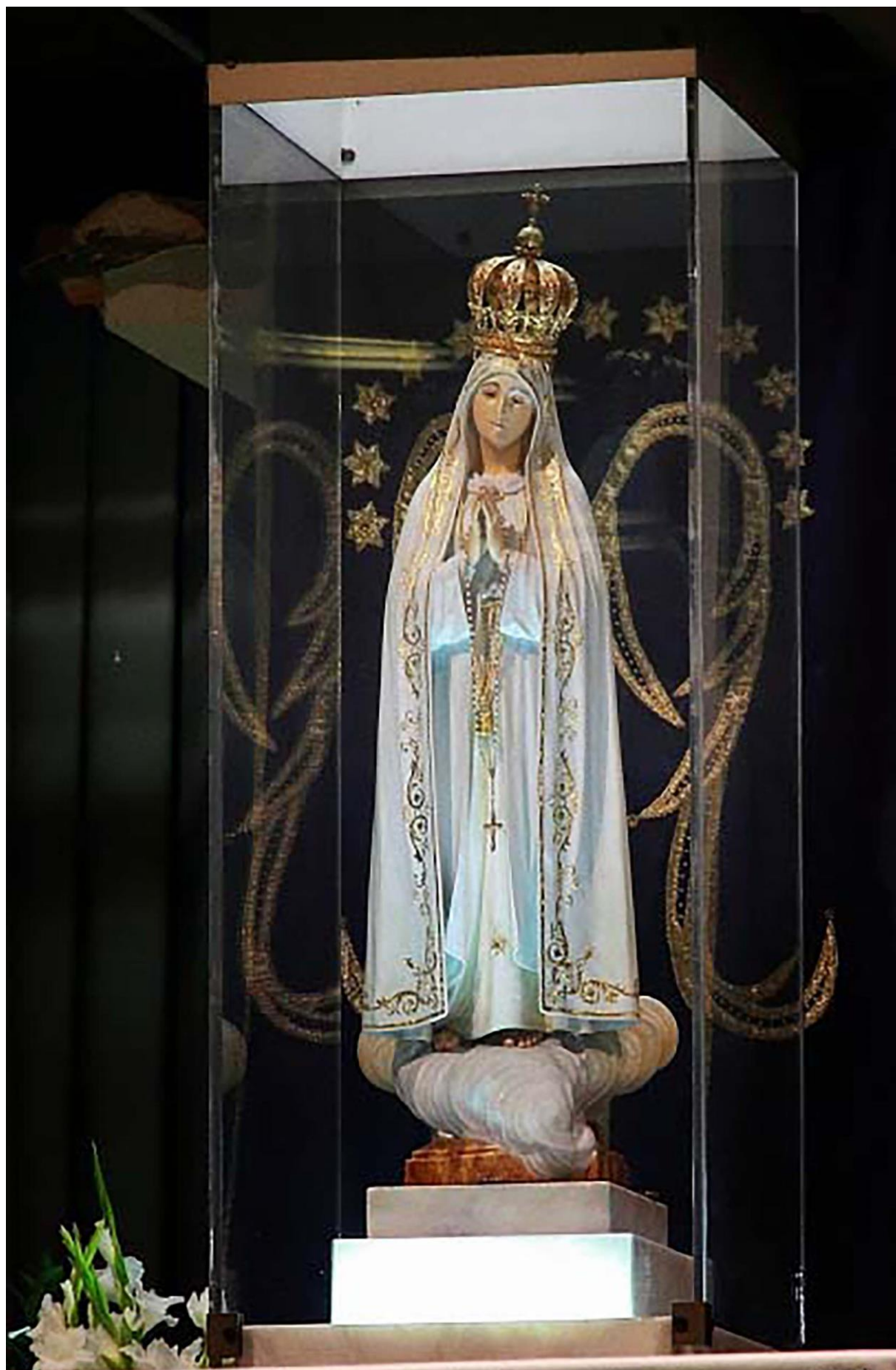
Marienstatue in der Erscheinungskapelle, Fatima